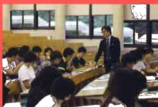
過去のスキルアップセミナー